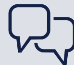
Onorari per consulenti e oratori