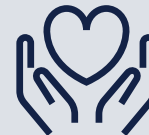
Donazioni e contributi benefici